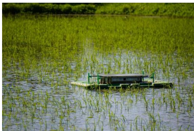
図1 水田で稼働中のアイガモロボ

アイガモロボはアイガモを用いたアイガモ農法(除草)に着想を得て開発され、効果が不安定なアイガモの代替として活用が期待されています。アイガモロボを導入したほ場の幼穂形成期 1) における平均の推定雑草乾物重 2) は16.6g/m 2 で、水稲の収量には影響しない程度でした。また、アイガモロボの使用により、生産者が従来から取り組む有機栽培(主に複数回の機械除草)と比較して、機械除草回数は平均で58%減少し、水稲平均収量(424kg/10a)は10%増加しました。以上より、アイガモロボは除草労力を削減しつつ水稲有機栽培の収量を確保する新たな雑草対策ツールとして有効であると考えられました。一方で、実証試験全体の3割程度でアイガモロボが正常に稼働しない事例も確認されました。アイガモロボを水田で