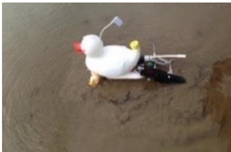
「開発初期のアイガモ(?)ロボ」