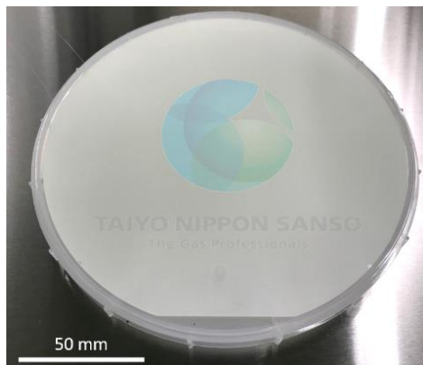
図 1 6 インチテストウエハ上に成膜した \beta -Ga 2 O 3 薄膜